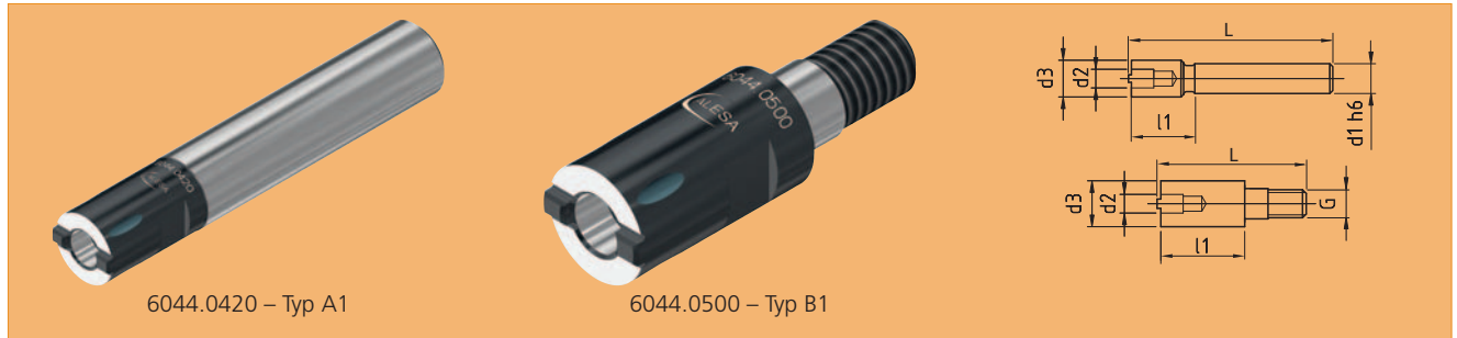
6044.0420 – Typ A1